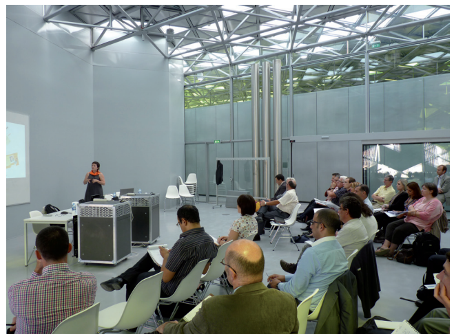
Atelier du club CLEF à la Cité du design

La mise en œuvre d'une économie de fonctionnalité offre ainsi une opportunité de rentrer dans une transition énergétique et écologique tout en renforçant la pérennité économique de l'entreprise.